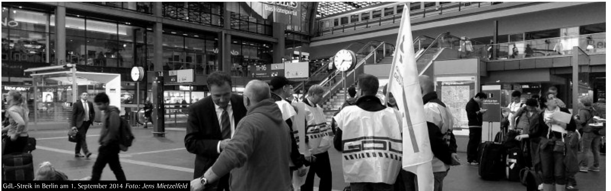
GDL-Streik in Berlin am 1. September 2014

Die öffentliche Debatte um die Streiks der GDL ist geprägt von einer Demagogie, bei der sieben Totschlagargumente eine zentrale Rolle spielen.