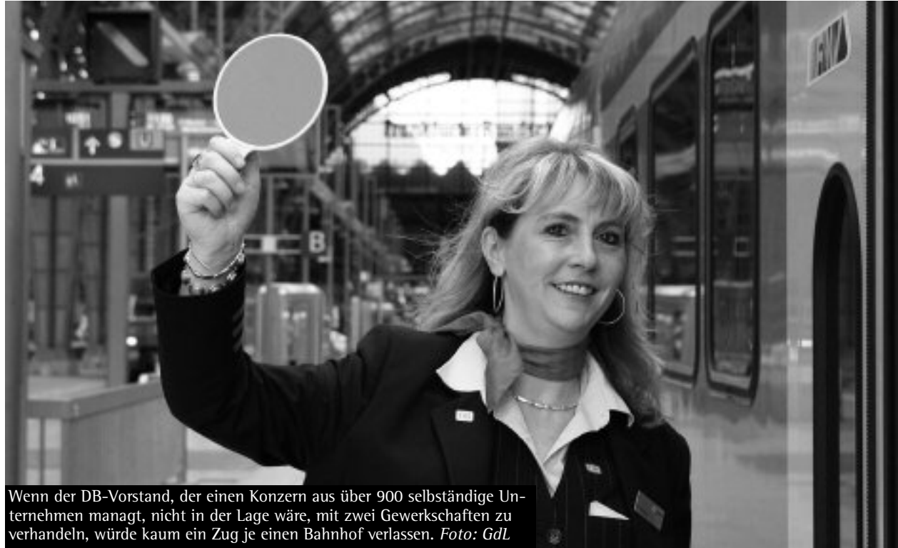
Wenn der DB-Vorstand, der einen Konzern aus über 900 selbständige Unternehmen managt, nicht in der Lage wäre, mit zwei Gewerkschaften zu verhandeln, würde kaum ein Zug je einen Bahnhof verlassen.

Als ehemaliger Gewerkschaftssekretär der damaligen Gewerkschaft Handel, Banken, Versicherungen (HBV im DGB) in Baden-Württemberg war ich von 1979 bis 2001 mit diesem Thema vertraut. Bis 1976 hatten sich in jeder Tarifrunde des Einzel- und Großhandels sowie Buchhandel/Verlage die HBV und die Deutsche Angestellten-Gewerkschaft (DAG), die nicht dem DGB angehörte, irgendwie über ein gemeinsames Vorgehen mit den Arbeitgebern verständigt. Wegen andauernder Kungeleien der DAG mit den Arbeitgebern erklärte 1976 die HBV-Landesbezirkskonferenz die DAG per Beschluss zur „gegnerischen Organisation“, mit der es keine gemeinsamen Tarifverhandlungen mehr gibt. Das war dann so bis 2001, als HBV und DAG zwei der fünf Gründungs-gewerkschaften von ver.di wurden.