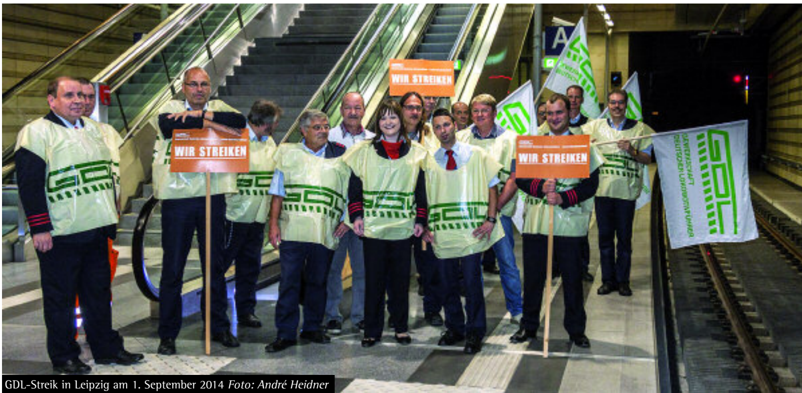
GDL-Streik in Leipzig am 1. September 2014

Können Sie uns mal sagen, was Lumpenjournalismus ist?