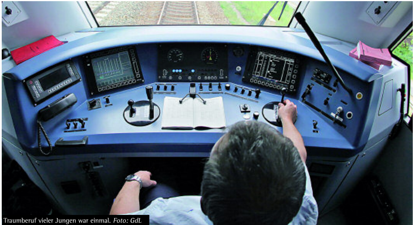
Traumberuf vieler Jungen war einmal.

Vor diesem Hintergrund darf es nicht verwundern, wenn die Forderung nach einer strikten Begrenzung der Überstundenzahl pro Jahr und nach einem Abbau