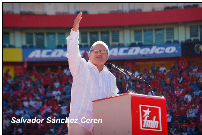
Salvador Sánchez Ceren

bierno donde han conseguido un importante avance en justicia social, paz y bienestar de la población.