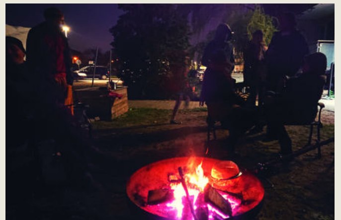
Gemeinschaft pflegen: Kneipe, Partykeller, Grillen und Lagerfeuer

Corona - natürlich waren auch wir davon betroffen. Während des Lockdowns kamen Räume für Kindergarten- und Schulkinder dazu. Eltern und Unterstützer*innen übernahmen die Betreuung und das Homeschooling. Eine solidarische Aktion in besonders herausfordernden Zeiten.