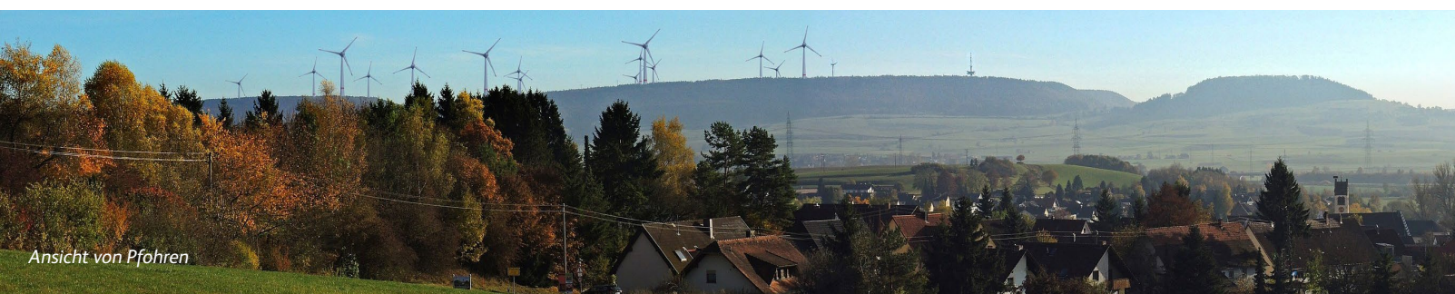
Ansicht von Pfhren