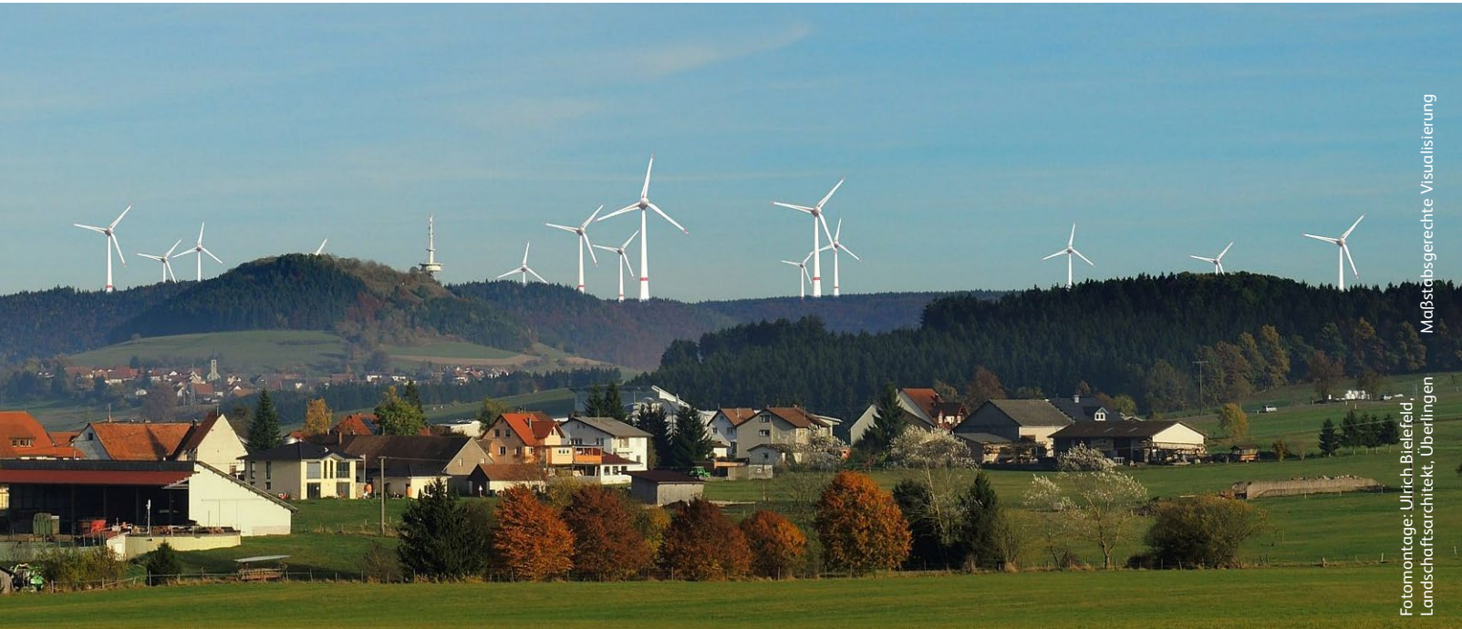
Fotomontage: Ulrich Bielefeld, Landschaftsarchitekt, Überlingen Maßstabsgerechte Visualisierung